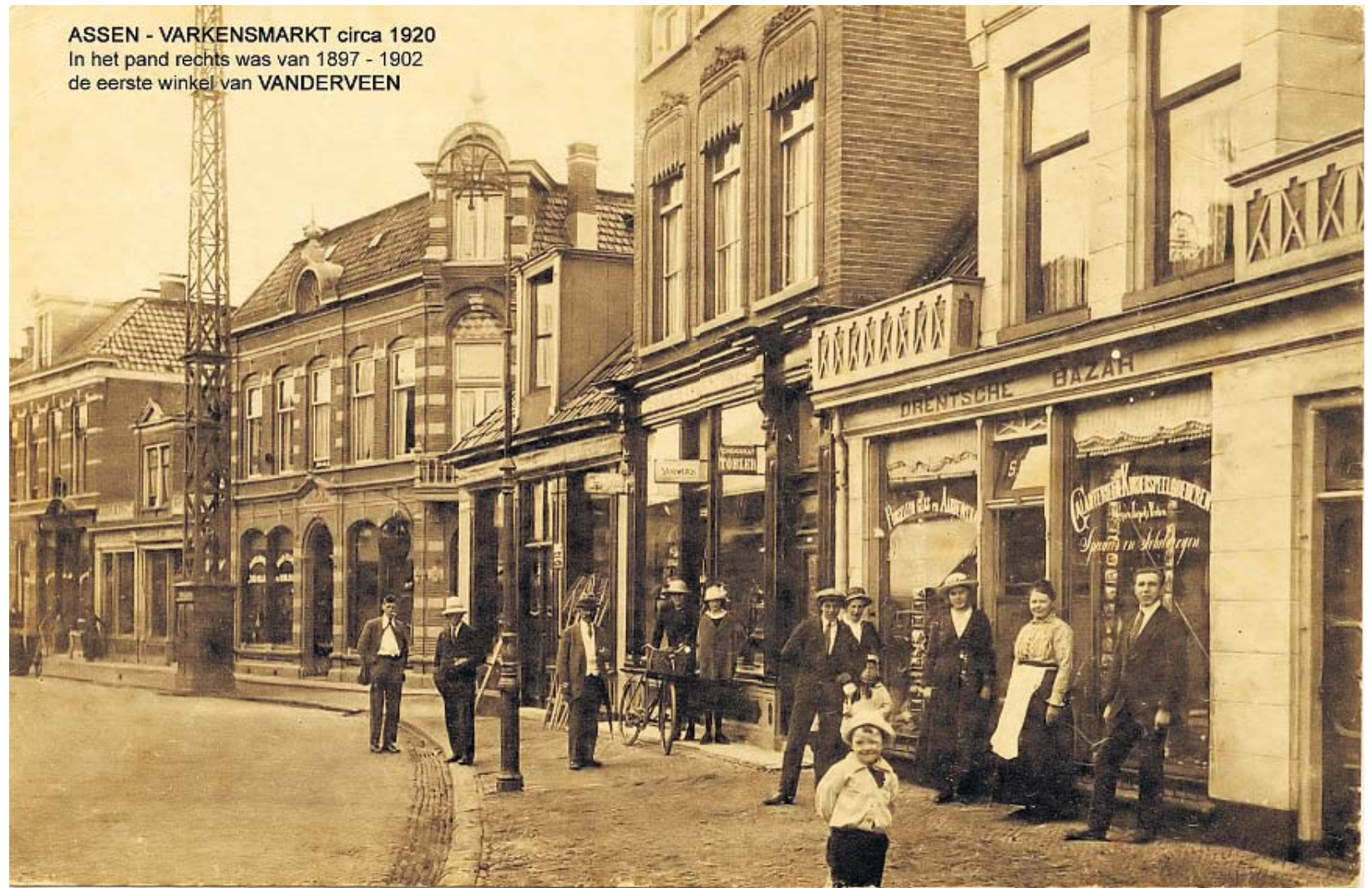
ASSEN - VARKENSMARKT circa 1920 In het pand rechts was van 1897 - 1902 de eerste winkel van VANDERVEEN